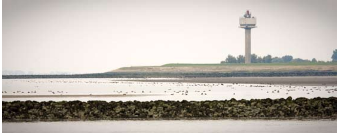
Schor van Waarde

Bij het Schor van Waarde (240 ha) zijn twee kribben aangelegd, die niet alleen gunstig zijn voor het behoud en herstel van de natuurwaarden ter plaatse, maar die ook verdere aantasting van de archeologisch waardevolle restanten van bewoning hebben voorkomen.