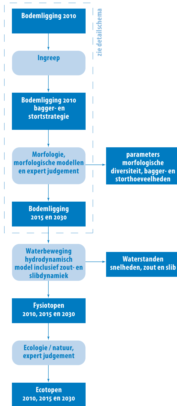
figuur B2-1 Overzichtschematische opeenvolging van de verschillende deelonderzoeken

Voor de bepaling van de effecten is in het Milieueffectrapport een keten van modellen en een interpretatie via expert judgement gehanteerd. Deze keten start bij de bodemligging voorafgaand aan de verruiming van de vaargeul en eindigt bij het bepalen van ondermeer de arealen van een aantal ecotopen. Deze keten wordt onderstaand weergegeven en verschilt op hoofdlijnen niet tussen het Milieueffectrapport en het Strategisch Milieueffectenrapport.