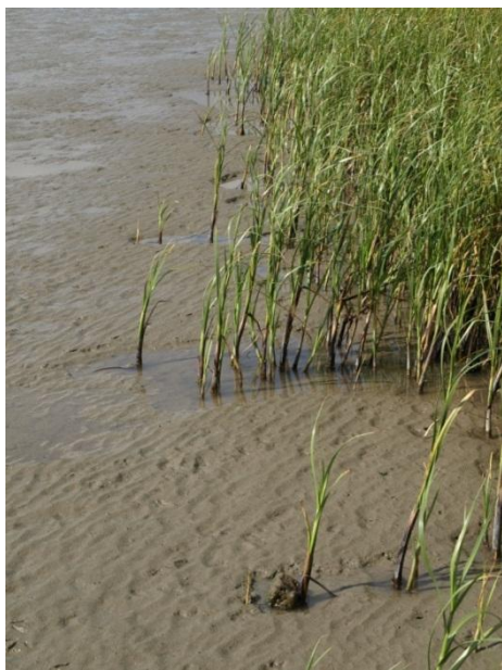
Figuur 1-3: Geleidelijke overgang van slik naar schor met zeebies vegetatie bij Bath (2012).

jaren weer fors af; in hoeverre dit een gevolg is van een overbegrazing van hun geprefereerd voedsel is nog onduidelijk.